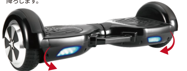
右足で前方向に体重をかけると左に曲がります。 左足で前方向に体重をかけると右に曲がります。