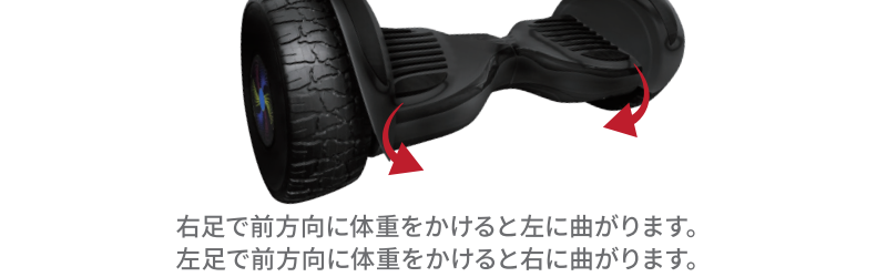
右足で前方向に体重をかけると左に曲がります。 左足で前方向に体重をかけると右に曲がります。

・ステップ5：体重移動により左右の足にかかる体重をコントロールして左右の進行方向を制御します。 ・ステップ6：降車する時は片方の足をボードから降ろして、次にもう片方の足を素早く降ろします。