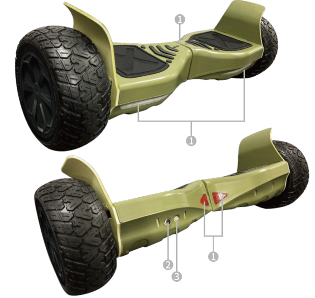
① LED：ステップに乗ると点灯 ② 充電ポート ③ 電源スイッチ