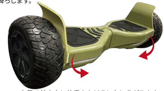
右足で前方向に体重をかけると左に曲ります。 左足で前方向に体重をかけると右に曲ります。